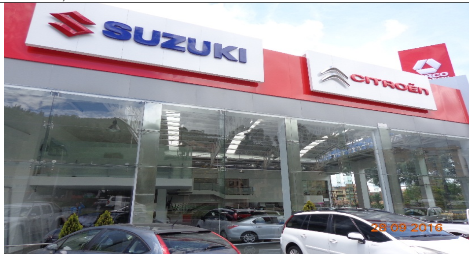
Fotografía No. 5 Vista de la fachada sentido Oriente – Occidente del establecimiento de comercio PARRA ARANGO Y CIA S.A, ubicado en la Avenida Carrera 7 No. 129 - 29.