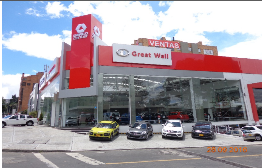
Fotografía No. 4 Vista de la fachada sentido Norte - Sur del establecimiento de comercio PARRA ARANGO Y CIA S.A, ubicado en la Avenida Carrera 7 No. 129 - 29.

ALCALDÍA MAYOR DE BOGOTÁ D.C. SECRETARÍA DE AMBIENTE