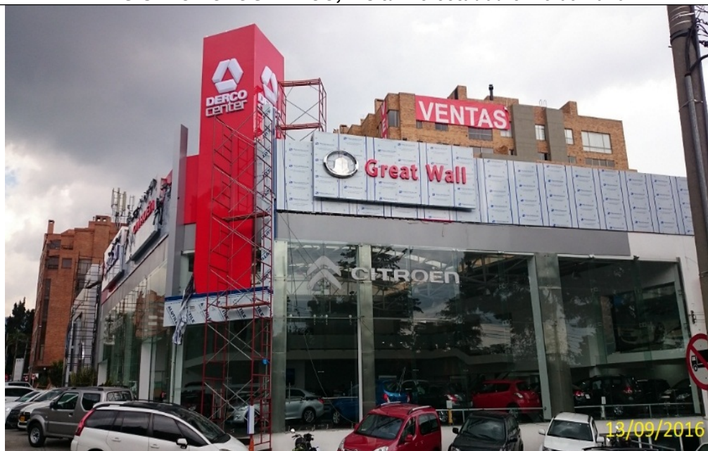
Fotografía No. 1 Vista de la fachada sentido Norte - Sur del establecimiento de comercio PARRA ARANGO Y CIA S.A, ubicado en la Avenida Carrera 7 No. 129 - 29.